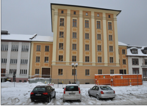
Ansicht Haus D, Bahnhofstraße