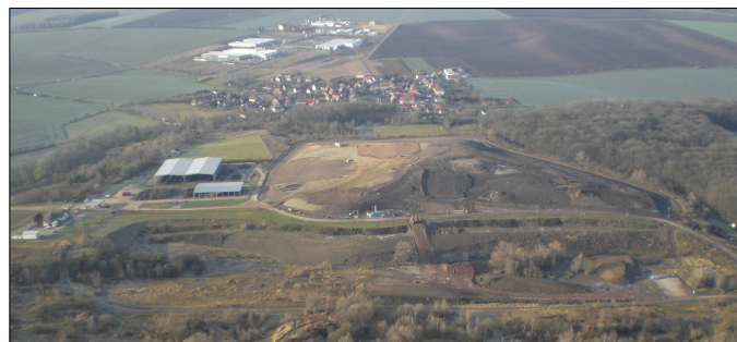
Deponie Weimar-Umpferstedt - Arbeitsstand Dezember 20