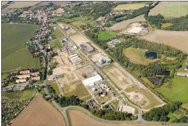
Luftbild des Werksgeländes während der Sanierung