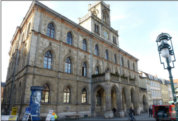
Das Rathaus zu Weimar, Ansicht vom Markt