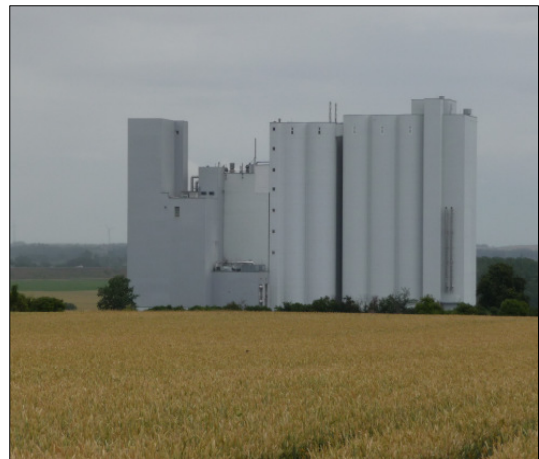
Ansicht der Mühle nach Erweiterung