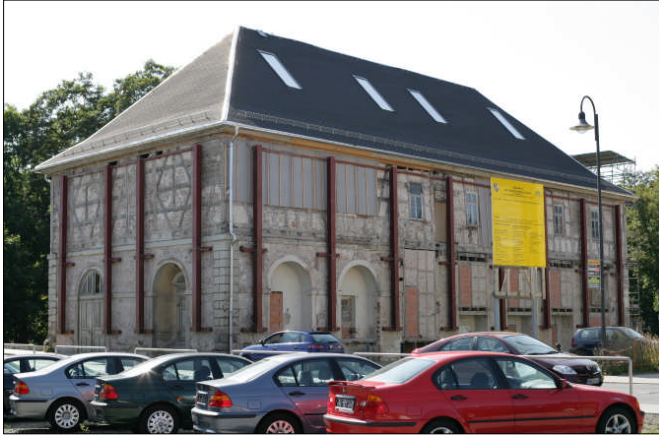
Das Kerngebäude im September 2006