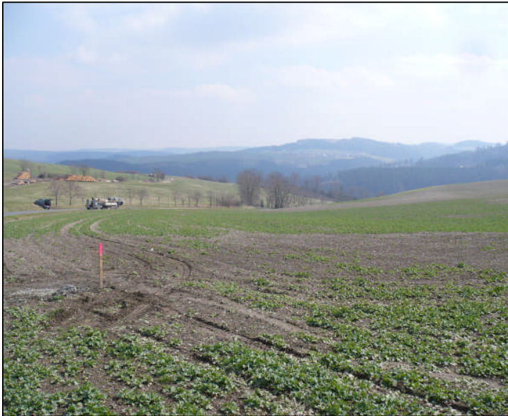
Ansicht des geplanten Baufeldes (Blick in Richtung Osten)