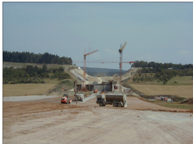
Baubereich VKE 5323, Blick auf den Einschnitt Büchelberg