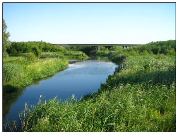
Trebeltal mit Blick auf die Trebeltalbrücke i. Z. d. BAB A20