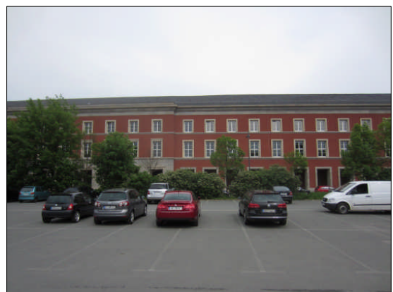
Baufeld in 2013