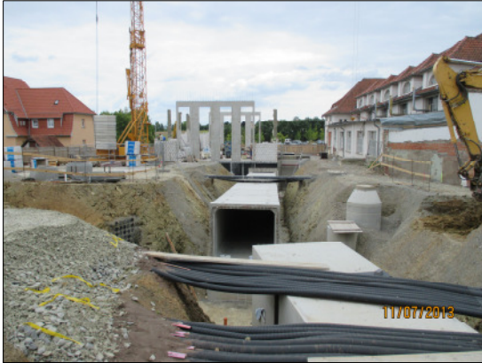
Anbindung Sammelkanal an Heizhaus